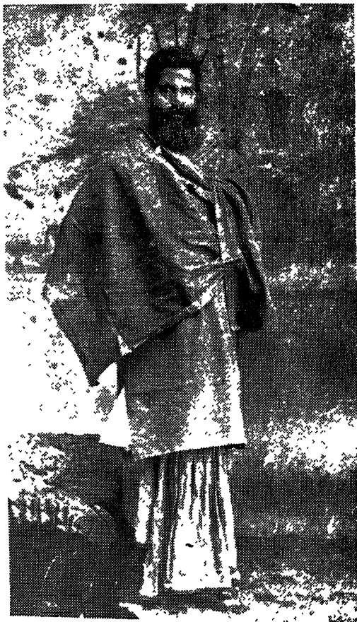
महात्मा मुन्शीराम जी ( स्वामी श्रद्धानन्दजी )